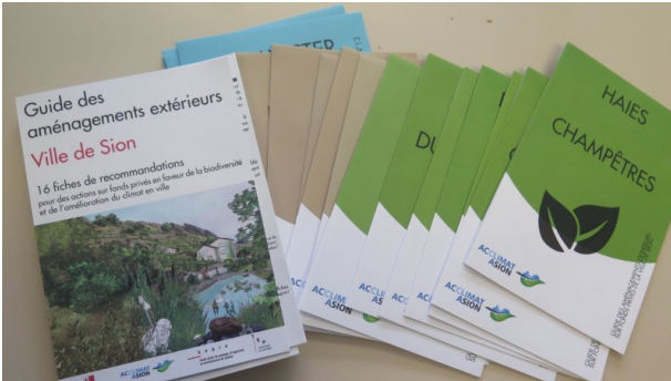
Copertina della guida di Sion

La città di Sion ha tradotto il suo grande progetto e le preziose conoscenze acquisite anche in una guida molto accattivante, semplice da consultare. Uno strumento pedagogico destinato anche al pubblico. Sion, fanno notare con orgoglio gli amministratori, è la prima città svizzera a sviluppare uno strumento di lavoro destinato ai privati, ma anche ai professionisti attivi nell'edilizia.